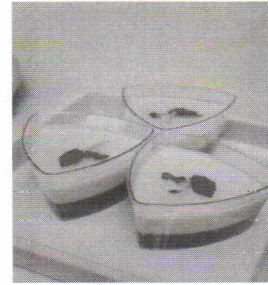
「去年の最優秀賞料理」

道の駅しかおい直売会では、地産地消を促進するために、花をテーマとし、地場産食材（主に鹿追産）を生かした料理を広く募集し、一般に紹介することによって、花の新たな魅力を感じ、更なる地場産食材の活用促進を図ります。